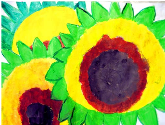
Abb. 2: Schülerarbeit „Sonnenblume“

Im Unterricht erproben die Schüler auf unterschiedlichen Bildträgern vor allem folgende Gestaltungsmittel : Farbauftrag (deckend, pastos, lasierend), Mischen von Farben, Größe und Beziehung von Farbflächen.