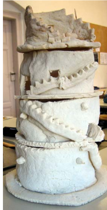
Abb. 4: Schülerarbeit „Turmbau zu Babel“

Am Beispiel von Alltagsgegenständen machen die Schüler erste Erfahrungen mit dem Thema Design. Sie beurteilen am Beispiel von Alltagsgegenständen die Einheit von gestalteter Form und praktischer Funktion und werden selbst gestalterisch tätig.