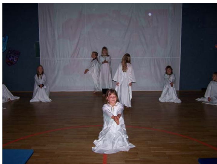
Abb. 5: Schüler-Performance (Foto)

In einfachen körperbezogenen Handlungen üben die Kinder das Zusammenspiel von Körperbewegung, Handlungsstrategien, Zeit- und Raumwirkungen, Gestik, Mimik, Akustik, Medieneinsatz usw. Der Lernbereich „Aktionsbetontes Gestalten“ ist deshalb besonders geeignet, das Körpergefühl zu stärken, die Wahrnehmung zu sensibilisieren sowie gedankliche Übertragungen zu meistern.